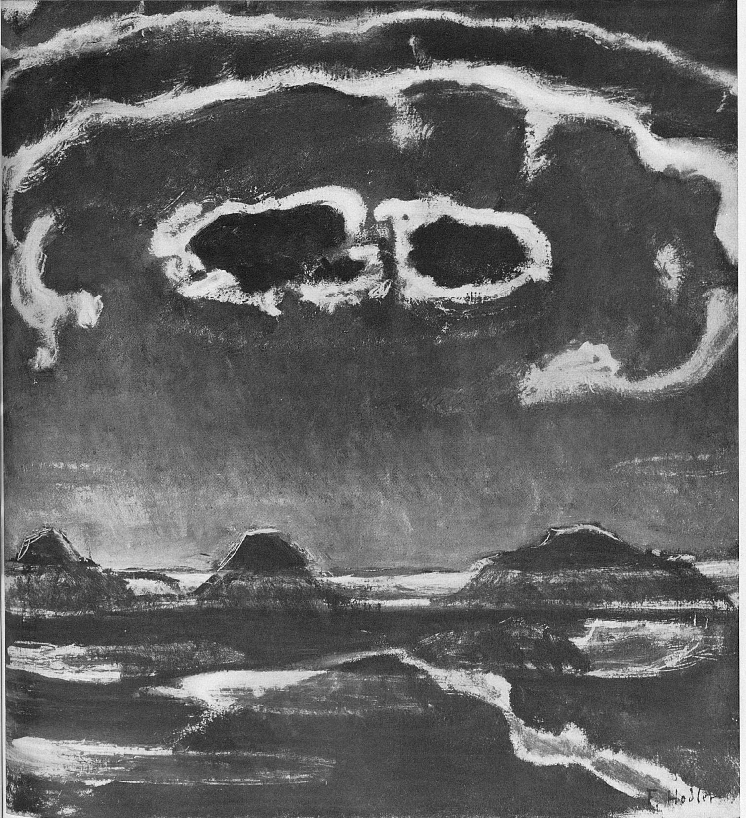
Ferdinand Hodler: Die Mondnacht, 1908 (Eiger, Mönch und Jungfrau) – Clair de lune, 1908 – Chiaro di luna, 1908 – Moonlight night, 1908.