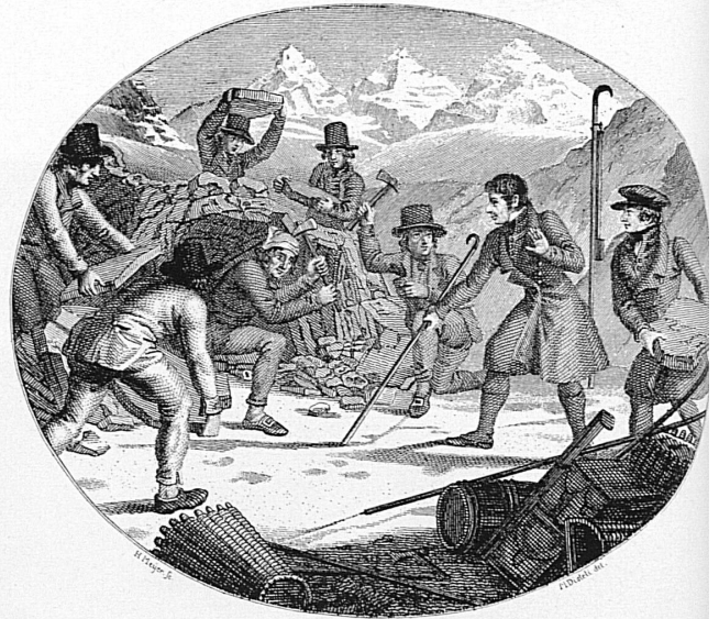
Bau einer Unterkunftshütte im Berner Oberland. Aus F. J. Hugi: «Naturhistorische Alpenreise», 1830. Les travaux de construction d'un refuge dans l'Oberland bernois, vers 1830. Costruzione d'un rifugio alpino nell'Oberland bernese, verso il 1830. Building a mountain hut in the Bernese Oberland, circa 1830.