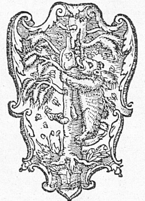
Mathias Apiarius, Bern 1539

Alte schweizerische Buchdrucker- und Verleger-Signete Quelques anciens labels d'imprimeurs et d'éditeurs Antichi emblemi di stampatori ed editori svizzeri Old Swiss insignia of printers and publishers