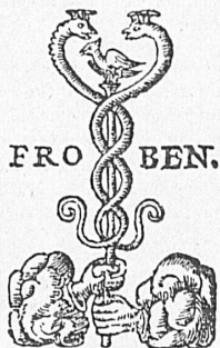
Offizin Frobenius, Basel

All'Helmhaus di Zurigo, dal 16 settembre all'8 d'ottobre, è indetta una grande mostra dell'editoria elvetica, alla quale partecipano 70 case circa. Una sezione della mostra ha carattere retrospettivo e documenta quanto antiche siano le origini dell'arte libraria in Svizzera.