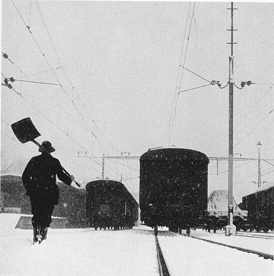
In den verschneiten Bahnhofanlagen von Le Locle im Neuenburger Jura. La gare du Locle (Jura neuchâtelois) sous la neige. Gli impianti di stazione di Le Locle (nel Giura neocastellano) ricoperti di neve. The snowed-in railway station at Le Locle in the Jura mountains.

Dining-car comfort is the subject of the most recent poster issued by the Publicity Department of the Swiss Federal Railways. Design: Hugo Wetli.