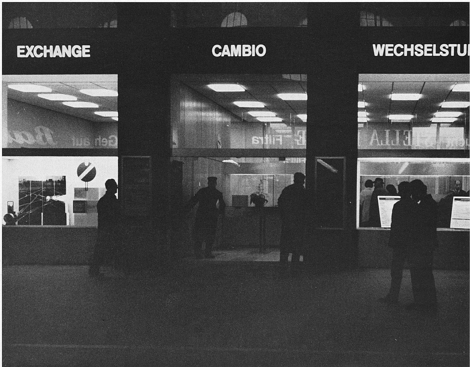
Die neue Wechselstube im Zürcher Hauptbahnhof. Le nouvel office de change de la Gare centrale de Zurich Il nuovo ufficio del cambio nella Stazione centrale di Zurigo New money-changing office in Zurich's main station

Mehr als 40 000 Personen stehen im Dienste der SBB