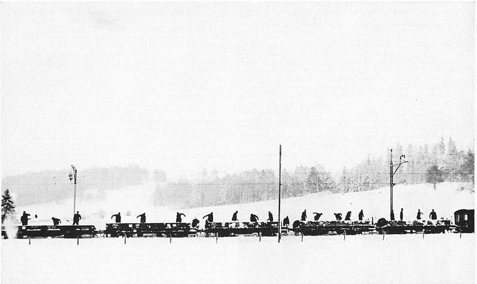
Bilder der Arbeit von den Schienensträngen unserer Bahnen. Oben: Abtransport des Schnees aus den Geleiseanlagen von La-Chaux-de-Fonds. Er wird auf freiem Felde abgeladen.