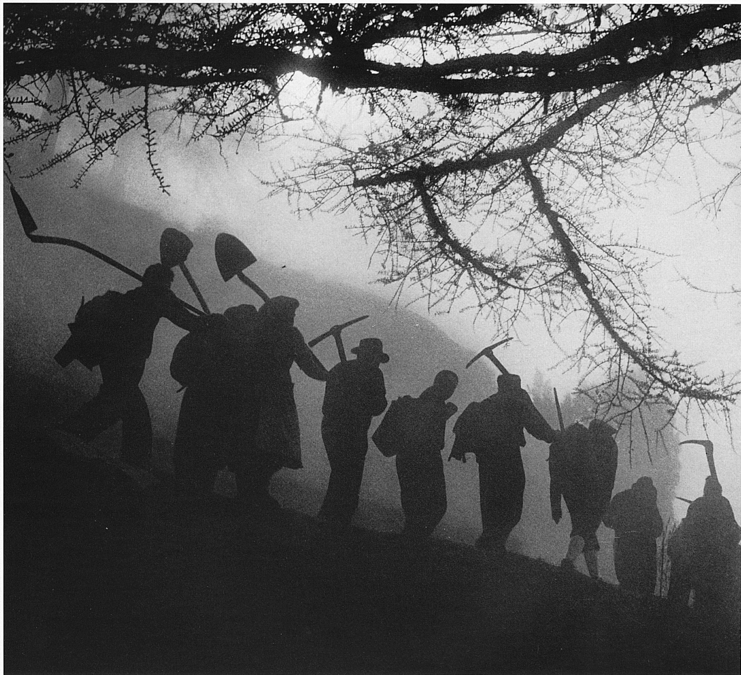
Die Bauern von Ergisch auf dem Weg zum Wasserleitwerk. Paysans d'Ergisch en route pour la bisse. I contadini di Ergisch in cammino verso l'acquedotto. Farmers from the village of Ergisch on the way to their aqueducts.

Auch wenn das Wasser einmal läuft, muss die Leitung immer wieder überprüft werden. ▶ Zum Zeichen, dass er die Kontrolle korrekt ausgeführt hat, steckt dieser Bauer eine « Dassel », das heisst ein Holztäfelchen mit seinen Kerben (Hauszeichen), in einen alten Arvenstrunk zuhinterst an der Wasserleitung.