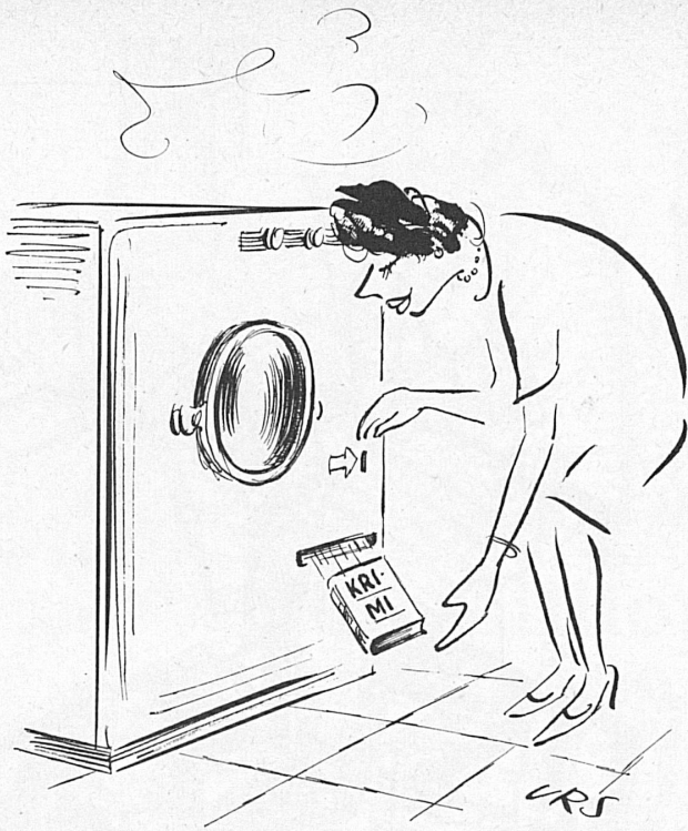
Das Neueste in Sachen Waschmaschinen