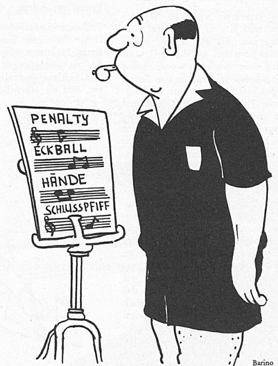
Schiedsrichter im Training