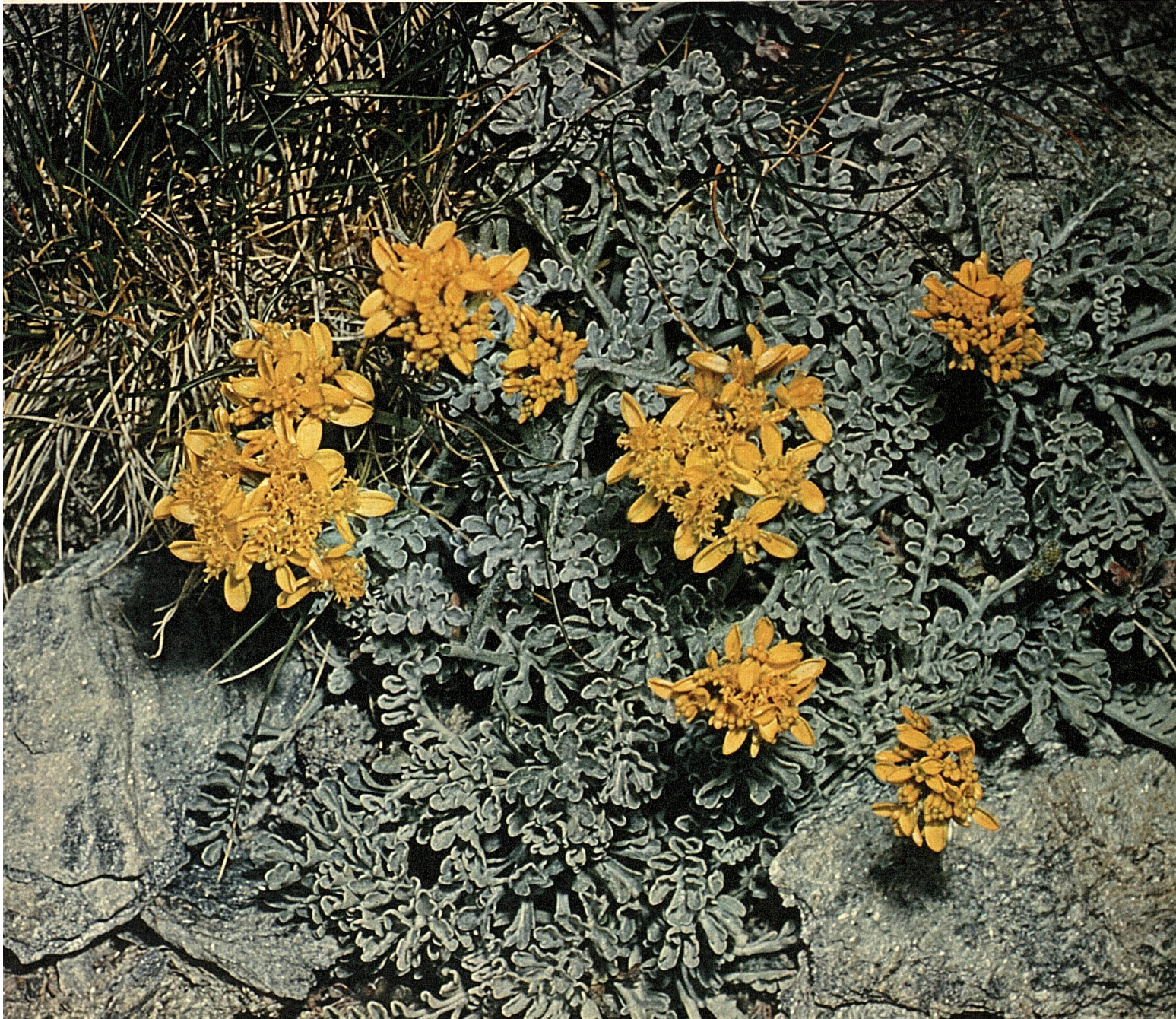
Graues Kreuzkraut / Sénéçon blanchâtre (Senecio incanus)

Herausgeber: Schweizerische Verkehrszentrale Editeur: Office national suisse du tourisme Editore: Ufficio nazionale svizzero del turismo