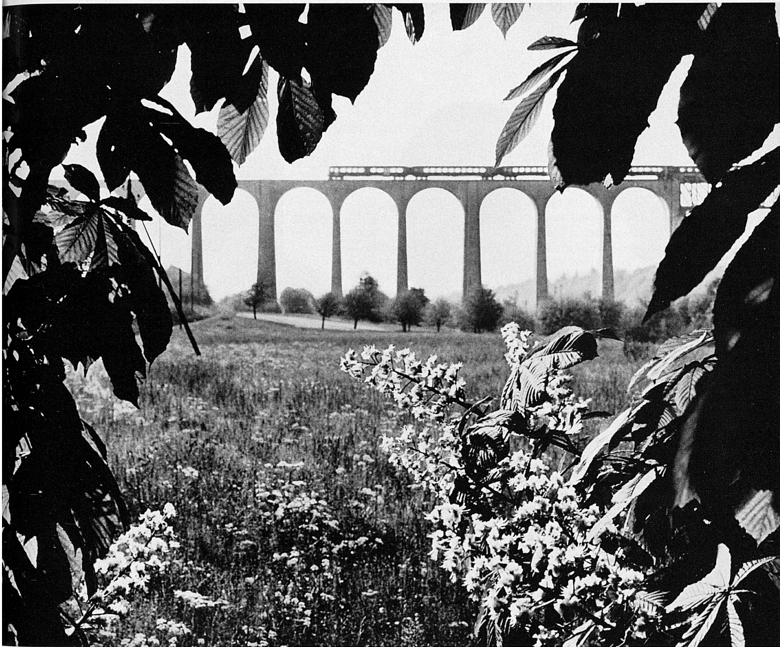
RHINE VIADUCT NEAR EGLISAU

RHEINVIADUKT BEI EGLISAU. Der Eglisauer Viadukt wurde in den Jahren 1895 bis 1897 von der Nordostbahn gebaut für die neue Gotthardzufahrt Schaffhausen-Zürich über das deutsche Gebiet von Jestetten. Der Viadukt ist 457 m lang, und seine grösste Höhe über der Fundamentsohle beträgt 65 m. Zwanzig gemauerte Gewölbekronen von 15 und 12 m Lichtweite überspannen den Talboden, während der Rhein durch einen 90 m langen Fachwerkträger überbrückt wird (in unserem Bild rechts vom Laub verdeckt). Das gesamte Mauerwerk misst 22000 m 3 , der Eisenträger wiegt 672 Tonnen.