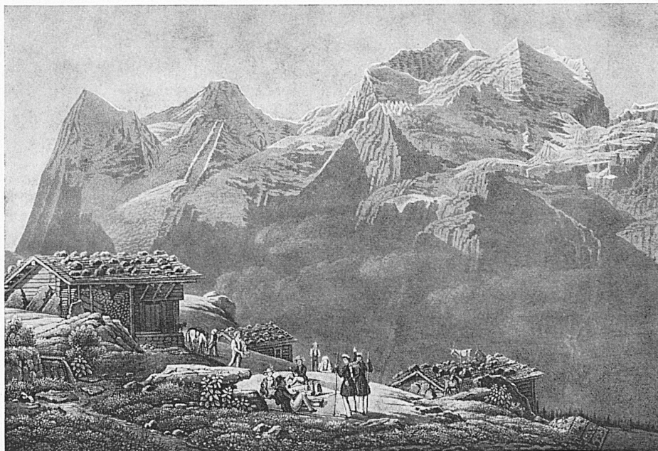
Wengernalp und Jungfrau Gruppe, Zeichnung von Gabriel Lory fils, erste Hälfte 19. Jahrhundert Wengernalp et le massif de la Jungfrau, dessin de Gabriel Lory fils, première moitié du XIX e siècle Wengernalp e gruppo della Jungfrau, disegno di Gabriel Lory figlio, prima metà del XIX secolo Wengernalp and Jungfrau group, drawing by Gabriel Lory the Younger, first half of the 19 th century

Far along, From peak to peak, the rattling crags among Leaps the live thunder! Not from one lone cloud, But every mountain now hath found a tongue, And Jura answers from her misty shroud Back to the joyous Alps, who call to her aloud!