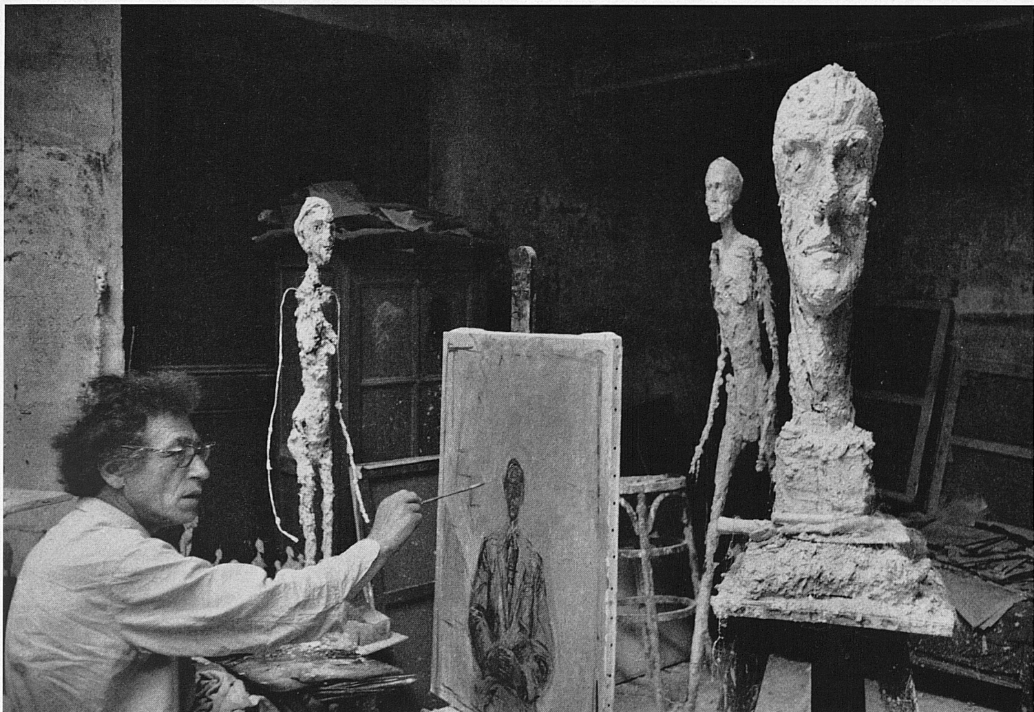
Der Plastiker, Zeichner und Maler Alberto Giacometti, 1901–1966 Alberto Giacometti: peintre, graphiste et sculpteur, 1901–1966 Alberto Giacometti (1901–1966), scultore, pittore e disegnatore svizzero Alberto Giacometti, escultor, dibujante y pintor, 1901 a 1966 The sculptor, designer and painter Alberto Giacometti, 1901–1966