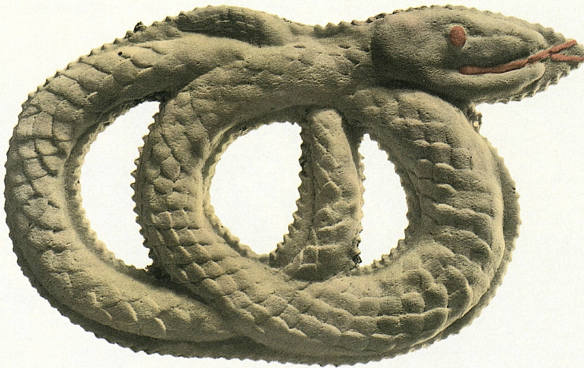
Festtagsgebäck aus Stans, Nidwalden • Biscuit de fête, de Stans (canton de Nidwald) • Dolce festivo anguineo proveniente da Stans, nel Nidwalden

Découpez un poulet bien conditionné et faites-le sauter dans une grande poêle, avec de nombreux lardons taillés dans du lard gras du Tessin. Ne poussez pas trop le feu, il faut que les lardons et morceaux de poulet se colorent uniformément jusqu'à belle blondeur. Le poulet, avec son foie et ses os, doit fournir passablement de jus. Allongez ce jus d'un peu d'excellent bouillon ou de concentré de viande, dégraissez-le un peu et versez-en les trois quarts sur des spaghettis tenus un peu fermes et filants. Servez le reste avec le poulet qui ne doit pas être trop cuit.