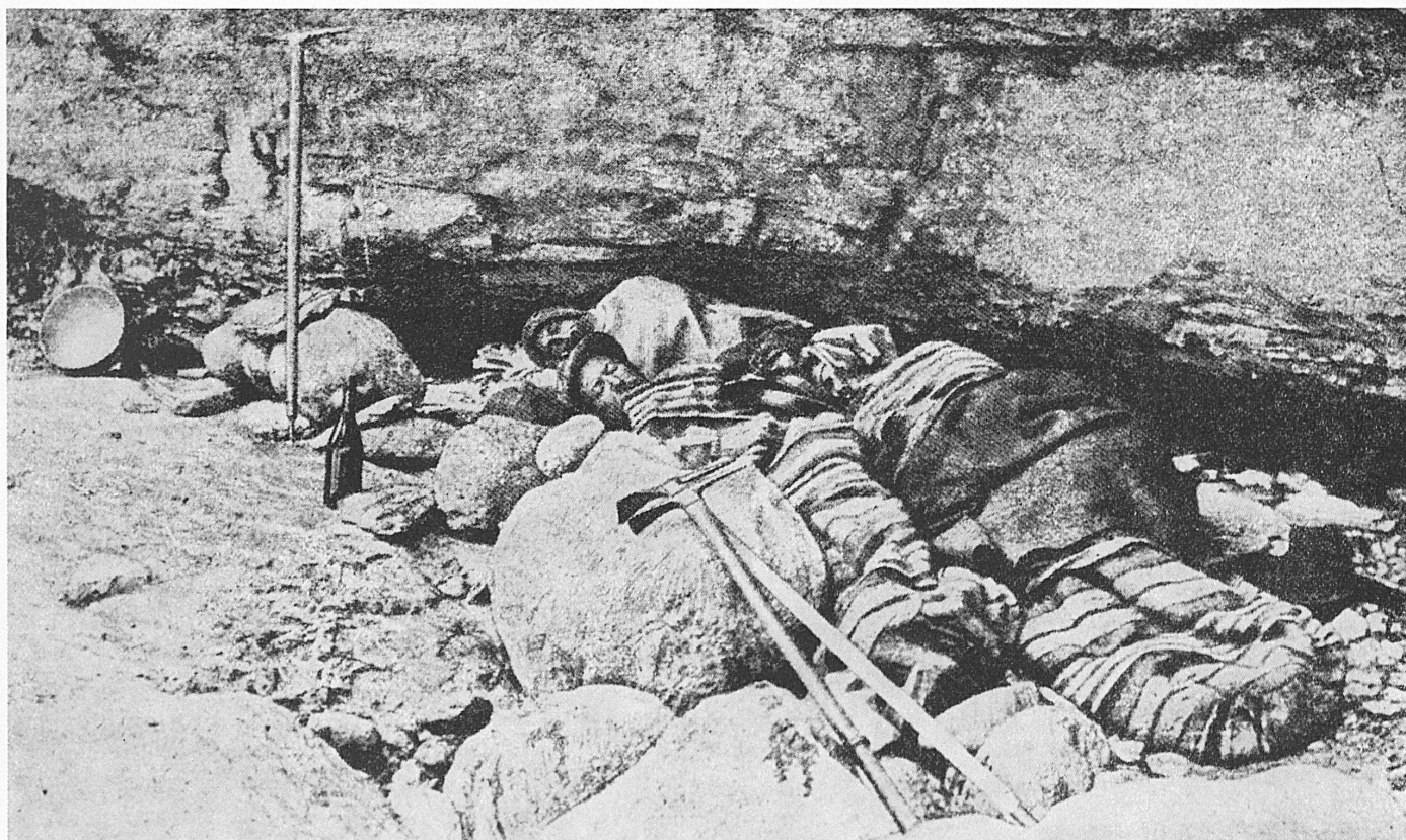
Ein Biwak von gestern • Un bivouac d'hier • Un bivacco d'altri tempi • A night on the mountain in the old days.