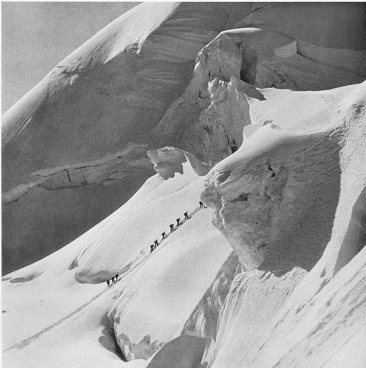
Auf dem Weg zum Ostgipfel des Piz Palü im Berninamassiv, Graubünden ● En route vers le sommet oriental du Piz-Palü, dans le massif de la Bernina Salita alla vetta orientale del Piz Palü, nel massiccio del Bernina, Grigioni ● On the way up to the East Peak of Piz Palü in the Bernina Massif, Grisons

◀ Blick vom Vierten Kreuzberg im Säntisgebirge, Kanton St. Gallen, in die Westseite des Dritten Kreuzberges, 2020 m. In der tiefsten Falte dieses grandiosen geologischen Schaustücks verläuft der Aufstieg.