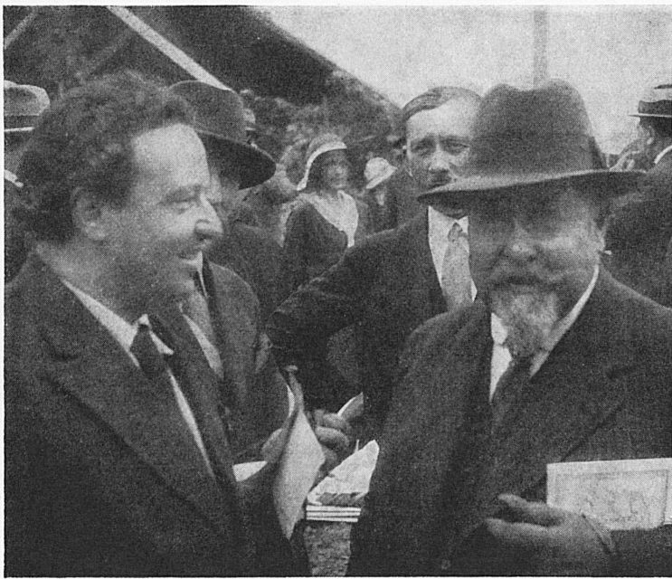
Arthur Honegger et Jaques-Dalcroze à Mézières à l'occasion de la « Belle de Moudon ».