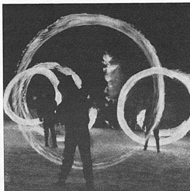
DER STROHMANN VON SCHULS/SCUOL

Im Brauchtum verschiedener Orte ist der Strohmann das Symbol des Winters, und wenn es dem Frühling entgegengeht, wird er in feierlichem Zeremoniell verbrannt. Sinnfällig wird ein solcher Brauch, das Verbrennen des «Bööggs», auch am Zürcher Sechseläuten begangen. Sehr früh dran mit dem Feuertod des Wintersymbols ist der Unterengadiner Badekurort Scuol/Schuls. Dort wird der Strohmann, der «Hom Strom», bereits am 4. Februar, wie üblich am ersten Sonntag dieses Monats, dem Flammentod überantwortet, zu einer Zeit also, da noch kaum ein Mensch, zumindest kein Wintersportler – fast alle sind es jetzt dort oben –, an Frühlings Erwachen denkt. Der Brauch des «Hom Strom» geht auf heidnischen Ursprung zurück. Am frühen Sonntagmorgen sammeln die Schulser Knaben bei den Bauern das Stroh, das sie zur grossen Puppe zusammenfügen. Unter Liedergesang von jung und alt wird diese dann am Abend, wenn es dunkel geworden ist, verbrannt.