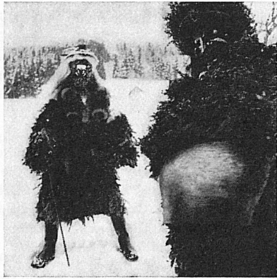
URNÄSCH: DER JULIANISCHE SILVESTER

Während im übrigen Appenzellerland die Silvesterkläuse am letzten Tag unseres (Gregorianischen) Kalenders ihr auf vorgeschichtliche Beschwörungsriten zurückgehendes Wesen und Unwesen zu treiben pflegen, hält sich Urnäsch alter Tradition getreu an den vorchristlichen Julianischen Kalender, der den 15. Januar als Silvestertag festhält. Wie die Urnäser Silvesterkläuse an diesem Tag, böse und gute Geister darstellend und phantastisch maskiert, mit Kuhglocken und Kugelschellen, jodelnd, singend, tanzend und lärmend von Haus zu Haus ziehen und für ihre tolle Aufwartung Gaben in Empfang nehmen, das ist ein im Volke tief verwurzeltes Fest, dessen einzigartigem Zauber sich auch der fremde Besucher nicht entziehen kann.