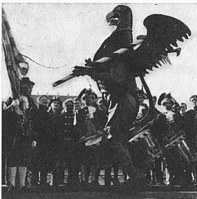
DER FESTTAG DER KLEINBASLER

Am Samstag, 27. Januar – dem traditionellen Turnus vom 15., 20. oder 27. Januar entsprechend – kommt der Wilde Mann auf dem Floss, begleitet von Tambouren und Bannern, mit Böllerschüssen den Rhein herunter nach Basel: Das ist der Auftakt des in dunkler heidnischer Vorzeit wurzelnden Kleinbasler Brauchs, der als «Vogel Gryff» von den drei Kleinbasler Ehrengesellschaften «Hären», «Rebhaus» und «Greifen» gehegt und durchgeführt wird. In der Nähe des Gesellschaftshauses wird der Wilde Mann von den personifizierten Wappenhaltern der beiden andern Gesellschaften, vom «Vogel Gryff» und dem «Leu», abgeholt, und auf der Mittleren Rheinbrücke werden dann nach genau festgelegtem Ritus die trommelbegleiteten Tänze aufgeführt. Im Gesellschaftshaus der «Greifen» folgt nun das «Gryffemähli» mit muntern Reden und Gegenreden, wobei der berühmte Basler Witz voll zu seinem Rechte kommt, und der Nachmittag gehört den weitem Tanzaufführungen der drei Ehrenzeichen.