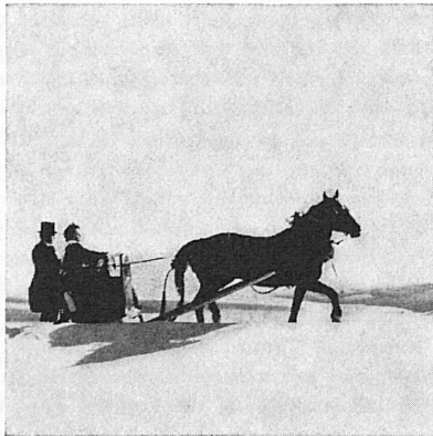
ST. MORITZ, PONTRESINA, SAMEDAN: SCHLITTEDA ENGIADINAISA

Die Schlitteda ist ein Stück engadinischen Brauchtums, das sich durch die Jahrhunderte hindurch erhalten hat, auch wenn es nicht an bestimmte Tage gebunden ist, sondern an verschiedenen Sonntagen im Januar und Februar in den grösseren Ortschaften des Engadins abgehalten wird. Es ist das Fest der Ledigen. Die jungen Burschen laden die heiratsfähigen Mädchen zu einer Pferdeschlittenfahrt in die Umgebung ein, und auf den Engadiner Bockschlitten, die vielfach als kunsthandwerklich fein gearbeitete Prunkstücke zur stolz gehegten Zier alten familiären Erbbesitzes gehören, zieht nun die muntere Kolonne durch die winterliche Landschaft. Natürlich erscheinen die Paare an diesem Tage in ihrer Engadiner Tracht, die Mädchen im feuerroten Rock und den zierlichen Häubchen, die Burschen im Biedermeiergewand mit schwarzer Hose, farbiger Weste, Wollrock und Zylinder. Den pittoresksten Schlittedas wird man am 14. Januar begegnen können, wenn die Engadiner Giüventüna, die Jugend von St. Moritz sowohl wie auch von Pontresina, sich paarweise auf die frohe Schlittenfahrt macht, die nicht selten – es soll ja schon vorgekommen sein – auch zur ersten Fahrt in ein gemeinsames Leben werden kann. Pontresina wird am 9. Februar eine weitere Schlitteda engiadinaisa «zelebrieren». Am 21. Januar führt Samedan seine Schlitteda durch.