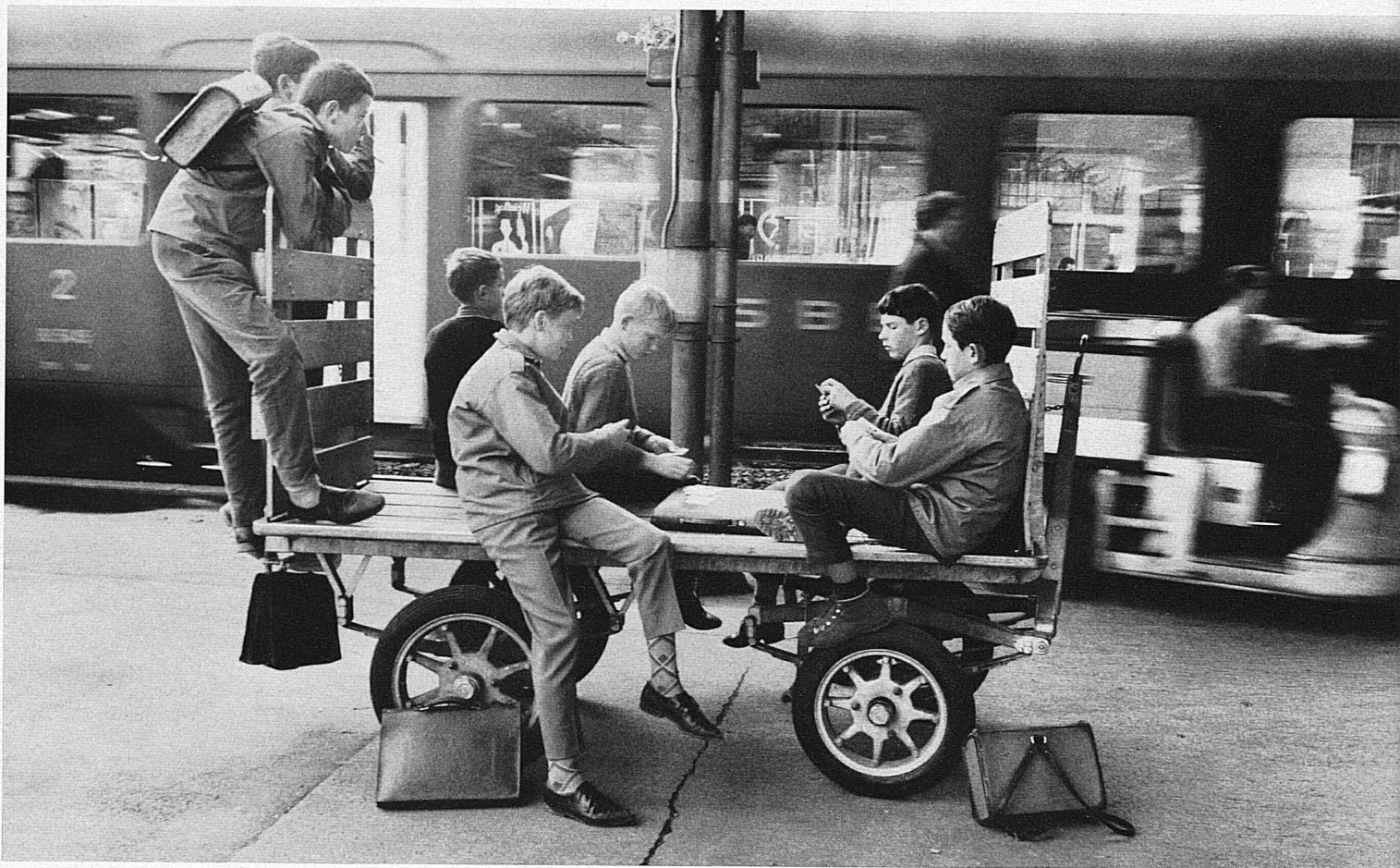
Diskussion im Bahnhof – Schüler warten auf ihren Zug. Dans l'attente du train Conversazione tra scolari in attesa del treno Debating in the railway-station—while waiting for the train that will bring them to school