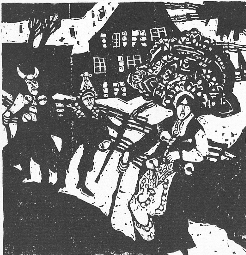
Bruno Gentinetta: Urnäsch am 13. Januar / Urnäsch le 13 janvier ▲