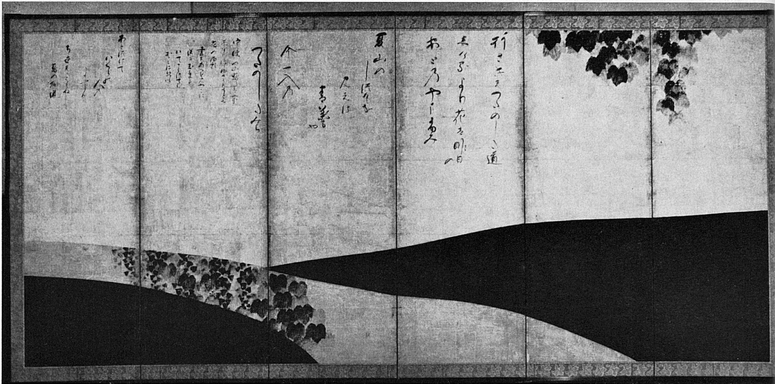
▲ Tawaraya Sôtatsu: Der Efeupfad. Erste Hälfte 17. Jahrhundert. Sechsteiliger Stellschirm (Paravent). Farben auf Papier mit Blattgold

Tawaraya Sôtatsu: Le sentier de lierre. Première moitié du 17 e siècle. Paravent à six pans. Couleurs sur papier recouvert de feuilles d'or