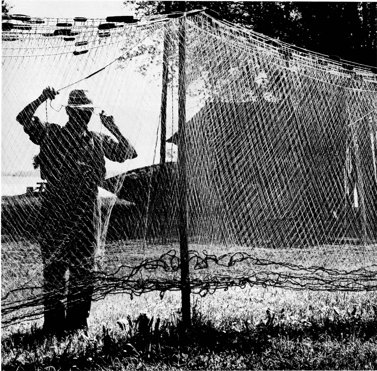
▲ Fischer bei Ermatingen am Untersee, Kanton Thurgau Pêcheur à Ermatingen, lac Inférieur (Thurgovie) Pescatore d'Ermatingen, sull'Untersee (bacino inferiore del Bodano) A fisherman spreads his nets to dry near Ermatingen, on the lower part of the Lake of Constance