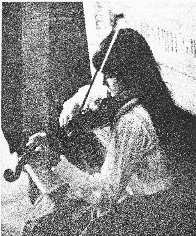
Soyez jeune — Restez jeune Vacances actives pour une jeunesse active en