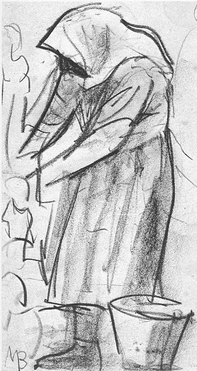
Weinlese. Zeichnung von Max Billeter. Zur Ausstellung des 70jährigen Künstlers in der Galerie Wolfsberg, Zürich

Vom 24. Oktober bis 1. November organisiert die Fotografische Gesellschaft Bern in der Schulwarte erstmals eine internationale Fotoausstellung, gewissermaßen als deutschschweizerisches Gegenstück zu den drei regelmässig in der Westschweiz und im Tessin stattfindenden Fotoausstellungen. In der neuen Berner Schau, die fortan ebenfalls als wiederkehrende Institution gedacht ist,