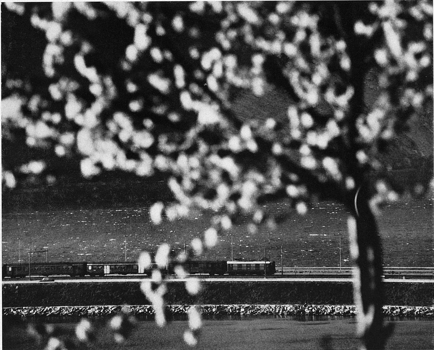
Zwischen Melide und Bissone überquert die Gotthardlinie auf einem Damm den Luganersee Entre Melide et Bissone, la ligne du Gothard traverse le lac de Lugano sur une digue Tra Melide e Bissone, la linea ferroviaria e la strada del S. Gottardo valicano il Ceresio su di una diga Between Melide and Bissone the Gotthard line crosses the Lake of Lugano on a dam

Ein Zug der Simplonlinie fährt am Pissevache vorbei, der als 65 m hoher Wasserfall bei Vernayaz ins Rhonetal stürzt. ▶