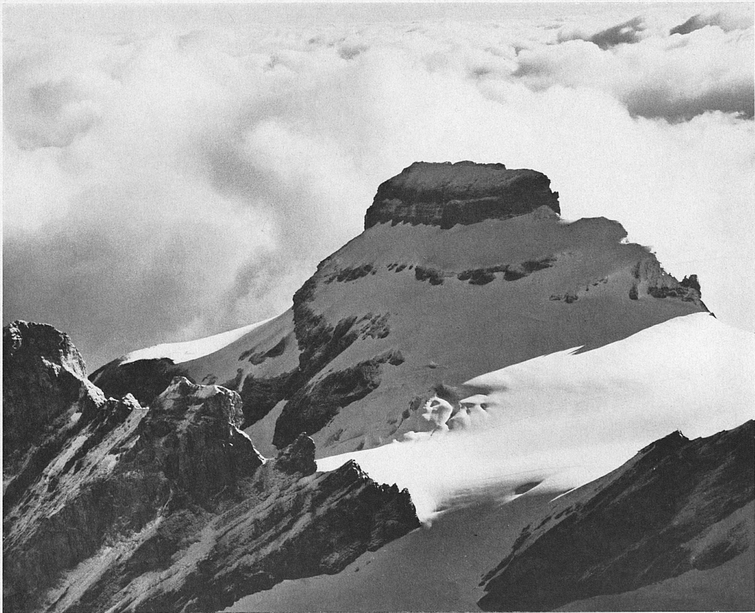
Die Wilde Frau, 3263 m, ein gewaltiger Felskopf in der Gebirgsgruppe der Blümlisalp über Kandersteg im Berner Oberland. La Wilde Frau, 3263 m, impressionnante croupe rocheuse du massif de la Blümlisalp, qui se dresse au-dessus de Kandersteg dans l'Oberland bernois La Wilde Frau, 3263 m, imponente massa rocciosa nel gruppo del Blümlisalp, sopra Kandersteg, nell'Oberland bernese Known as Wilde Frau—Wild Woman—this huge rock bastion rises to a height of 10,706 ft. from the Blümlisalp massif in the Bernese Oberland