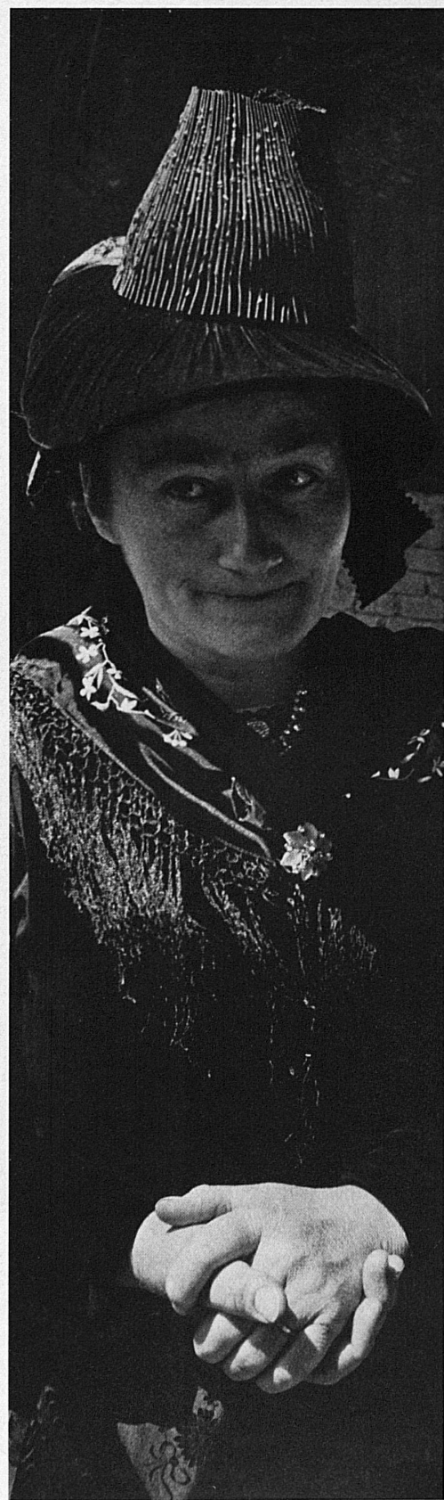
Campesinas serranas del Valais inferior y una fotografia de viñadores del Val d'Anniviers, que cultivan sus viñas en las alturas encima de Sierre, en el valle del Ródano. Para amenizar su trabajo toca, según tradiciones antiguas, un grupo de tambores y pifanos