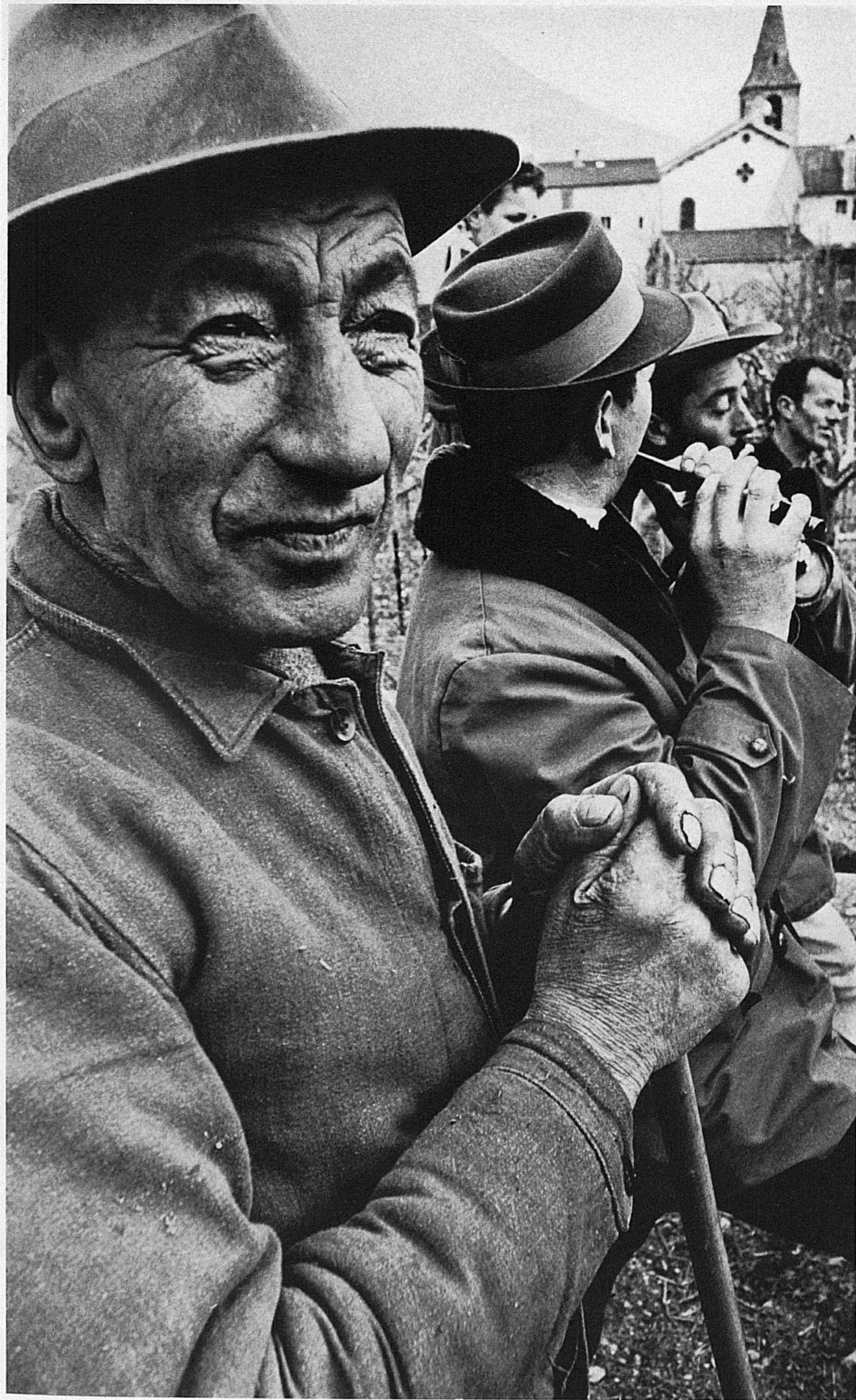
Contadine di montagna nel Basso Vallese. - e un'immagine di contadini della valle d'Anniviers che attendono ai lavori nei loro vigneti al di sopra di Sierre nella vallata del Rodano. Secondo una antica usanza, un gruppo di tamburini e di pifferai accompagna i lavori