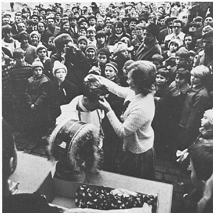
Die Krönung der Sieger. Im Vordergrund eine Kuhshelle als Wanderpreis ▲ Le couronnement des vainqueurs. Au premier plan: la grosse sonnaile: récompense que le gagnant transmet à celui de l'année suivante Premiazione dei vincitori. In primo piano, un campanaccio, premio itinerante Crowning the winners. In the foreground the challenge trophy: a cow-bell

Junger «Geislechlepfer» beim Training Jeune garçon s'entraînant au jeu du «Geislechlepfe» Addestramento nel maneggio della frusta A young "whipcracker" in training