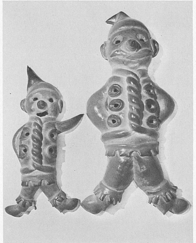
Zeichnung / Dessin: Hans-U. Steger

Aber auch mit dem Brauchtum des St. Niklaus hat das Gebäck etwas zu tun. Mit Sicherheit kann gesagt werden, dass der Grittibänz eine Nachahmung