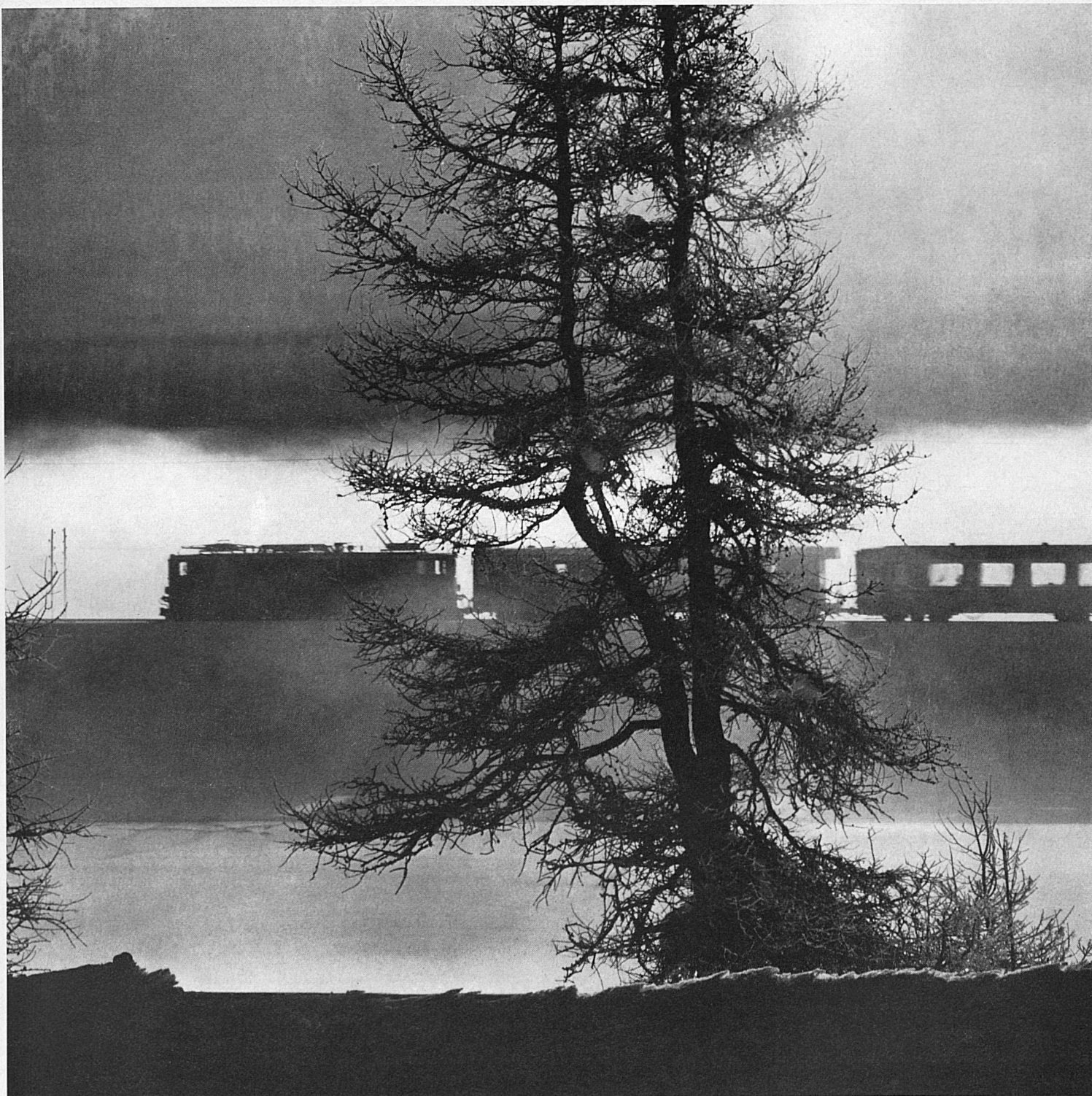
▲ Ein Zug der Rhätischen Bahn auf der Fahrt durch das Oberengadin. Haute-Engadine: un convoi du Chemin de fer rhétique Treno delle Ferrovie retiche in corsa attraverso l'Alta Engadina A train of the Rhaetian Railways on its way through the Upper Engadine

Zum nachfolgenden doppelseitigen Bild: Hoch über Vouvry liegt über dem Talboden der Rhone das Frühlings-Hochskitourengebiet der Cornettes-de-Bise am Grenzgrat zwischen dem Unterwallis und Savoyen. Rechts der Bildmitte der Hauptgipfel, 2432 m.