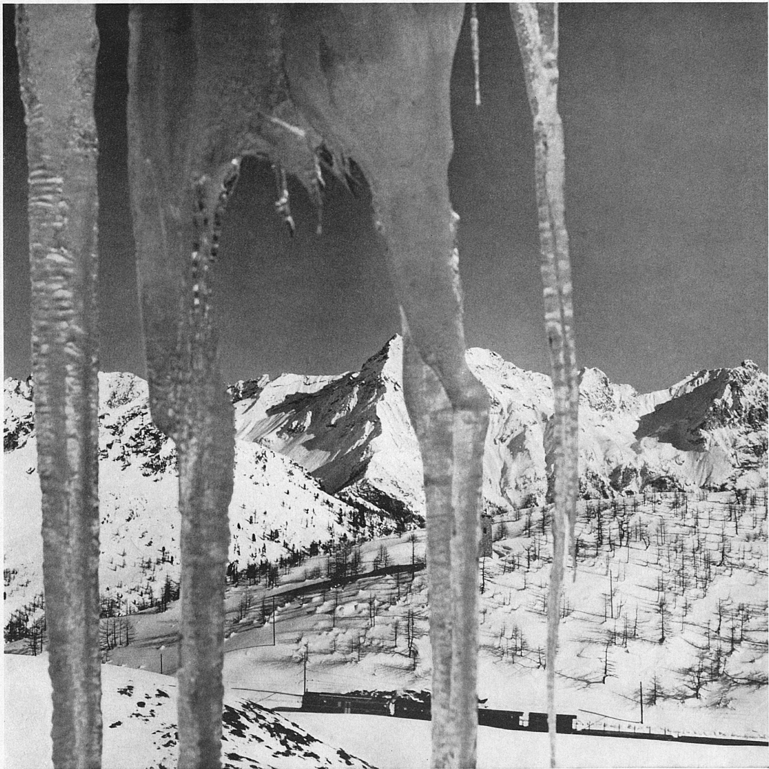
Die Berninabahn oberhalb Alp Grüm im Puschlav Un convoi du Chemin de fer de la Bernina au-dessus d'Alp Grüm, dans la vallée de Poschiavo La ferrovia del Bernina nel tratto sovrastante l'Alp Grüm, in Val Poschiavo The Bernina Railway above Alp Grüm in the Poschiavo Valley