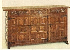
Buffet, 150 x 80 x 45 cm, anderswo 804.—, bei uns nur