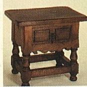
Kredenzil, 55 x 35 cm nur