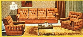
Hochwertige Multiarno-Leder-Garnitur, Sofa 4plätzig und 2 Rollen-Clubsessel, anderswo Fr. 3850.—, wie Bild, bei uns gratis geliefert nur Fr.