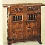
Schränkli, 90 x 80 x 40 cm nur