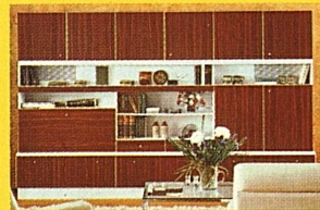
Moderne Luxus-Wohnwand, 300 cm, mit Bar, TV-Abteil, Stereo-Blenden, Besteckschubladen usw. Anderswo Fr. 2400.—, bei uns gratis gel.

...bei Möbel-Märki - viel günstiger als anderswo!