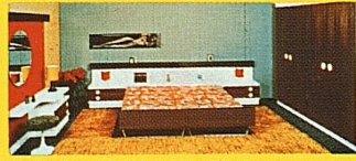
Apartment Doppel-Schlafzimmer mit ex- klusiver Toilette, indirekter Beleuch- tung, Listenpreis Fr. 3880.—, wie Bild, bei uns gratis geliefert nur Fr.