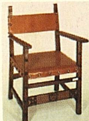
Sitz echt Leder, mit Armlehnen 198.—, ohne