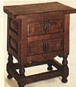
Kredenzil, 55 x 38 cm nur