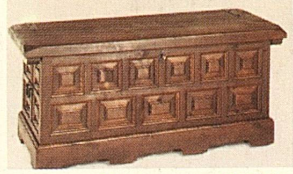
Truhe, 90 x 50 x 40 cm bei uns nur