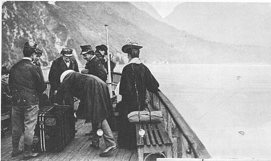
Lago di Lugano, Revisione doganale

«Zollrevision auf dem Luganersee.» Die Postkarte stammt aus einer Zeit, da die Schifffahrt als wichtige Fortsetzung der Eisenbahn im Fernverkehr diente