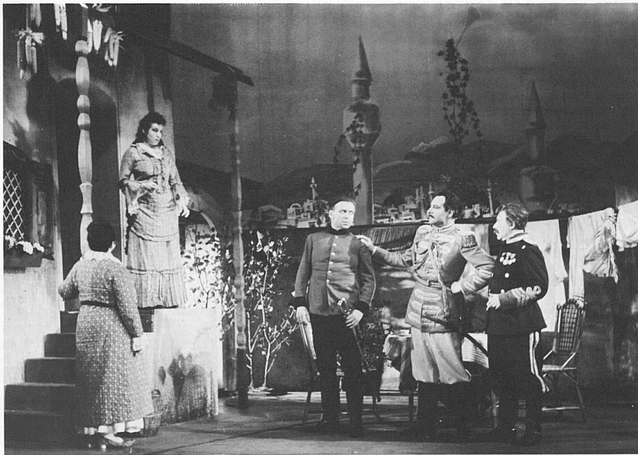
Der Schweizer Schauspieler Leopold Biberti (†1969) als Bluntschli in einer Inszenierung von Shaws «Helden» am Schauspielhaus Zürich 1939