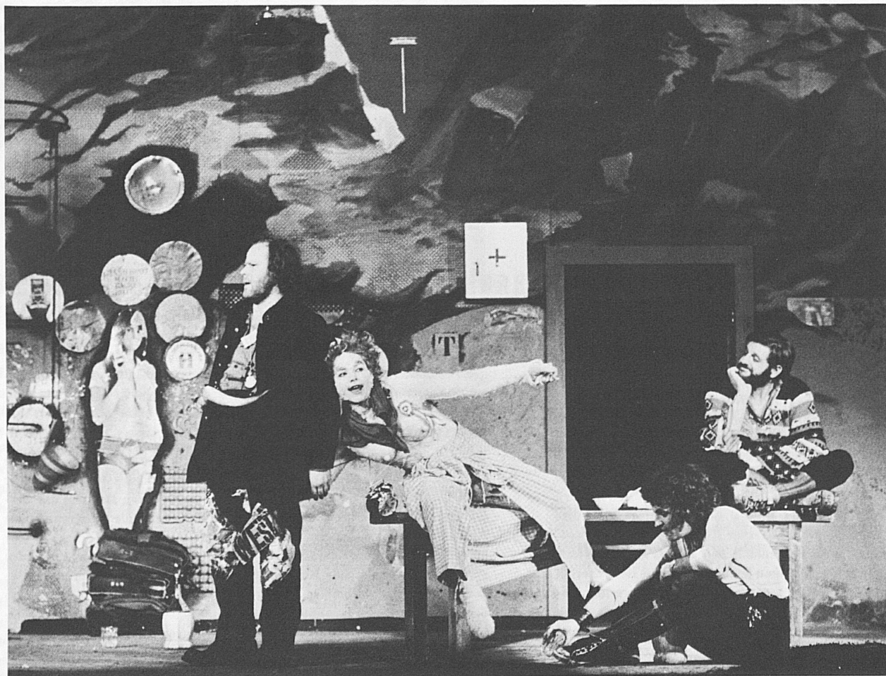
Hansjörg Schneider: «Sennentuntschi» Schauspielhaus Zürich 1972