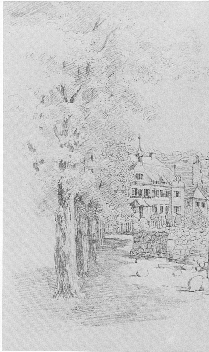
Lausanne-Ouchy en 1842, dessin de Félix Mendelssohn. A gauche, l'Hôtel de l'Ancre où lord Byron composa « Le Prisonnier de Chillon », poème qui contribua à faire connaître dans le monde le célèbre château

rische Berufung nie der geringste Zweifel: das musikalische Genie äusserte sich früh und eindeutig. Mendelssohns Bilder sind aus reiner Freude am Zeichnen und aus Liebe zur dargestellten Landschaft entstanden. Zeichnen war für ihn ein echtes Hobby, ein leidenschaftlich gepflegtes, wie aus folgender Briefstelle hervorgeht: «Schweizer Beschreibungen sind ja gar nicht zu machen, und statt eines Tagebuchs wie das vorige Mal zeichne ich diesmal ganz wütig darauf los, ich sitze tagelang vor einem Berg und suche ihn nachzumachen.» Vielleicht ist es diese Zeichenwut, die ihn davor bewahrte, das Erlebnis der Schweizer Landschaft unmittelbar in Musik umzusetzen. Zwar ist auch für Mendelssohn, den Romantiker, die Natur Quelle seines Schaffens, doch gelangte er nicht zur Tonmalerei wie Liszt, der zur gleichen Zeit in Genf lebte und in seinen frühen Klavierwerken, den «Années de Pèlerinage» etwa, Landschaftseindrücke unmittelbar wiedergab («Les cloches de Genève», «Le lac de Walenstadt», «La Chapelle de Guillaume Tell» . . .) und auch schweizerische Volksmelodien verarbeitet.