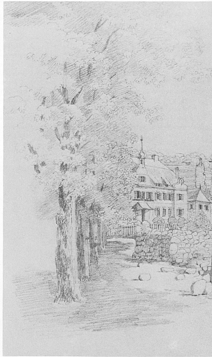
Lausanne-Ouchy en 1842, dessin de Félix Mendelssohn. A gauche, l'Hôtel de l'Ancre où lord Byron composa « Le Prisonnier de Chillon », poème qui contribua à faire connaître dans le monde le célèbre château

Lausanne-Ouchy, 1842, Zeichnung von Felix Mendelssohn-Bartholdy. Im Hotel de l'Ancre, links, verfasste Lord Byron sein Gedicht «Der Gefangene von Chillon», das dem Schloss zu Weltberühmtheit verhalf