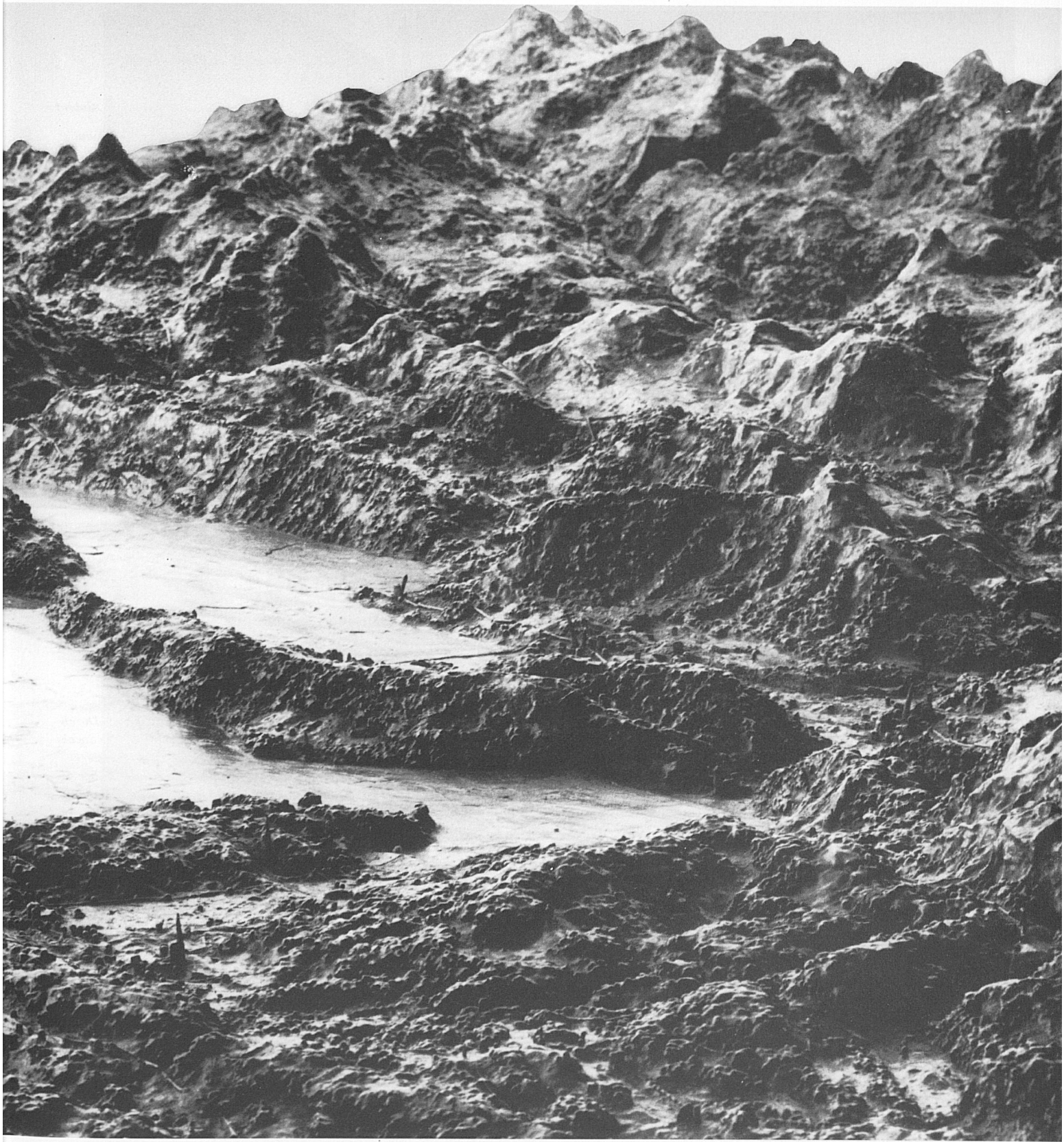
A section of the relief model of Central Switzerland completed by Franz Ludwig Pfyffer in 1786 and now in Lucerne's Glacier Garden Museum. This photograph of the model was taken looking southeast, with Lucerne and its lake in the centre. The model measures 21 ft. 8 in. by 12 ft. 10 in.