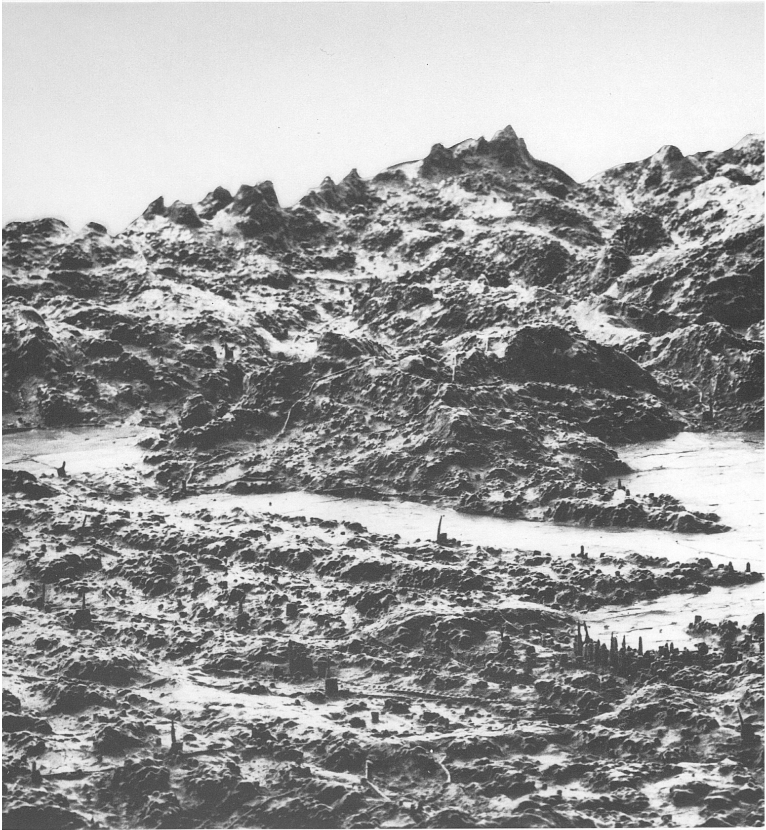
Ausschnitt aus dem 1786 vollendeten Relief der Urschweiz von Franz Ludwig Pfyffer, aufgestellt im Gletschergarten-Museum Luzern. Blick gegen Südosten, im Zentrum Luzern und der Vierwaldstättersee. Ausmasse: 660 × 390 cm.