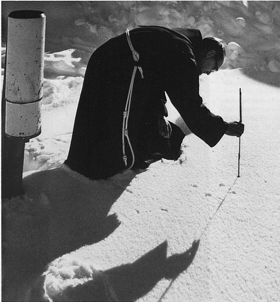
Andermatt: der Pfarrer als Wetterprophet

erwarten haben. Wer alles hinter diesen simplen paar Worten steckt, wissen aber wohl die wenigsten. Nämlich Leute von 150 Stationen, auf die ganze Schweiz verteilt, die dreimal täglich das Wet-