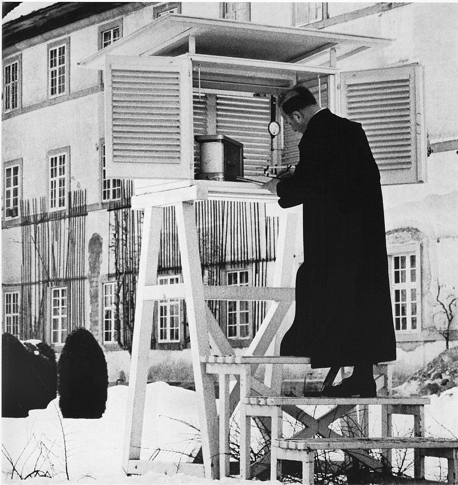
Im Klostergarten Einsiedeln.