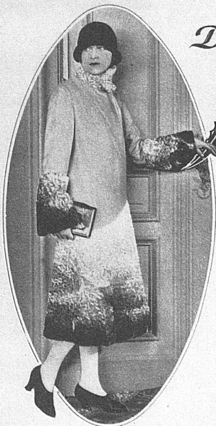
Neuer Mantel aus hellgrauem Winterkascha mit weiß-grau-schwarz ombriertem Persianer. Bemerkenswert sind die neuen hohen Armel-aufschläge