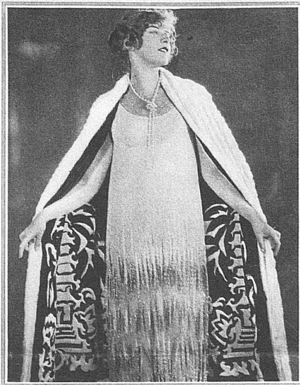
Über weißem Crêpe Georgette-Abendkleid m. Silberperlen ein elegantes Hermelin-Crêpe mit schwarzem, weiß applizierten Samtlutter