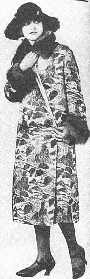
Bunter Brokatmantel mit Steinmarderbesatz und rostrotem Samthut mit Straßagalle