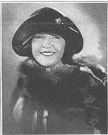
Goldbrauner Velours-hut mit dunkleren Streifen und goldener Nadel