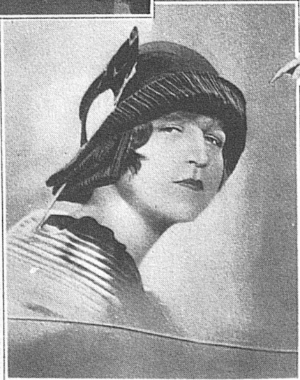
Neuer Laufhut aus schwarzem Velours, mit originell gebogener Vorderkrempe u. seitlichem Federgesteck