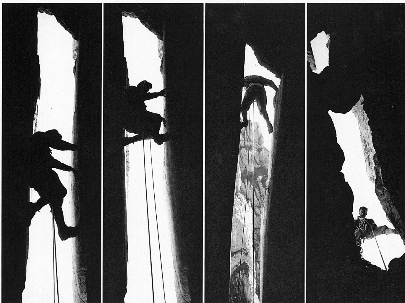
Über das Band hat der Kletterer den Kamin erreicht und stemmt nun eine Seillänge hoch...

Cette brève information sur l'altière tour rocheuse si appréciée des varappeurs figure dans le Guide des Churfürsten de la section UTO du CAS Zurich. Ce que la Roskirche a de plus caractéristique, c'est sans contredit la cheminée étroite et lisse qui la divise très profondément et par laquelle le grimpeur peut s'élever avec plus ou moins de peine selon sa stature et sa corpulence. Savoir s'arc-bouter dans les cheminées est un facteur important dans la technique de la varappe. L'ascension est toujours possible lorsque la roche présente des fissures et des cheminées. Mais certaines cheminées sont si larges que le varappeur ne peut souvent y grimper qu'en faisant le grand écart. Celle de la Roskirche est du type étroit. En s'appuyant du dos à une paroi et des pieds et des mains à l'autre, le grimpeur parvient à gravir la roche lisse de l'étroite fissure. Un bloc de pierre coincé dans la partie supérieure barre le chemin vers le sommet. On le franchit en pratiquant la technique de l'écart. La pointe de la Roskirche est trop exiguë pour qu'on puisse s'y allonger, mais on peut s'y asseoir assez commodément. Le temps d'admirer la vue sur le lac de Walenstadt à ses pieds et sur les parois rocheuses des Churfürsten en face, et déjà est venu le moment de redescendre en prenant soin de nouer la double corde pour s'en faire un siège.