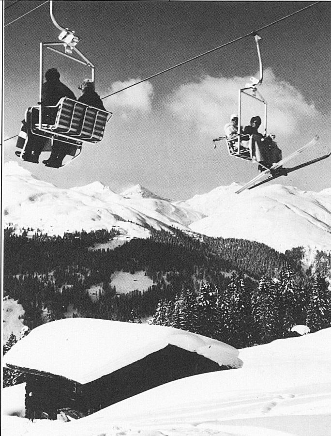
Sessellift Glaris-Rinerhorn (Davos)

Auskunft und Prospektmaterial: Kurverein Arosa, 7050 Arosa Telefon 081 31 16 21