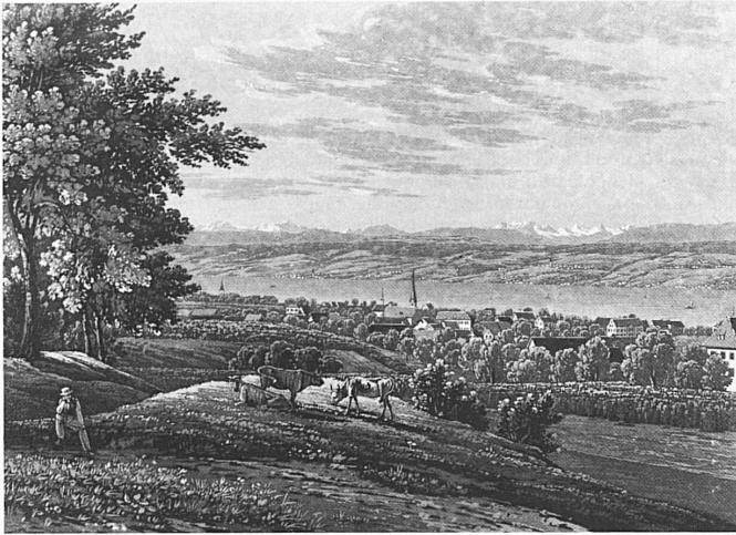
So idyllisch waren die Zürichsehänge noch im 19. Jahrhundert! Telles étaient encore au XIX e siècle les rives idylliques du lac de Zurich

lungsgebiet, rettet Waldlichtungen und gliedert die Ortschaft. 43 Hektaren befanden sich bereits in Gemeindebesitz, 32 Hektaren müssen von der Gemeinde noch entschädigt oder erworben werden. Kostenpunkt runde 70 Mio Franken! (Die betreffenden Gebiete sind – bei ohnehin hohen Bodenpreisen – baulich erschlossen, darum die hohen Kosten.) Eine Lösung in dieser Form ist freilich nur in einer mit üppigen Steuerzahlern gesegneten Gemeinde wie Küsnacht möglich – sie hat deshalb nur begrenzten Modellcharakter. So konnte sich die Gemeinde auch eine ausserordentliche Informations- (bzw. Werbe-)kampagne leisten, um die Stimmbürger zu überzeugen. Dennoch muss gesagt werden, dass andere, ähnlich wohlbestallte Gemeinden gegen das Verwuchern ihrer Ortschaft noch keinen Finger gerührt haben.