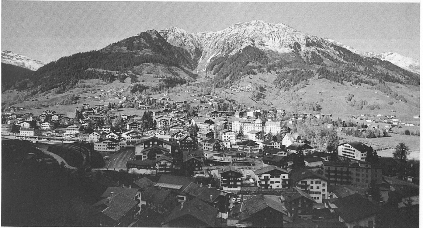
Klosters von Süden. Die bauliche Belastung durch die Entwicklung zum Massentourismus ist dem Ort anzusehen

Dergestalt «gewappnet» mit dem notwendigen Respekt vor seiner prachtvollen Bergnatur, darf Klosters heute hoffen, auch künftig für seine Bewohner wie seine Gäste anziehend zu bleiben. Der Kurort hat das Stadium noch nicht erreicht, wo eine Wende zum Guten nicht mehr möglich ist.