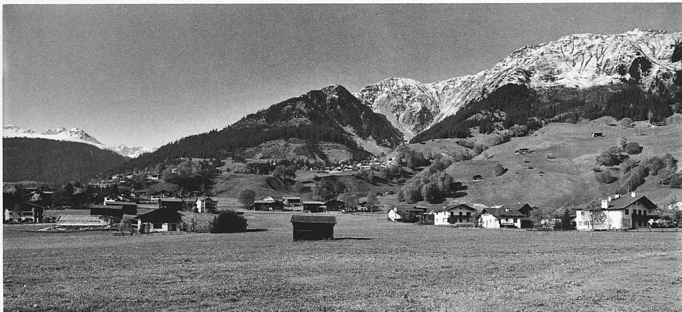
Diese Zone (links die Fraktion Monbiel) untersteht nun den Schutzbestimmungen