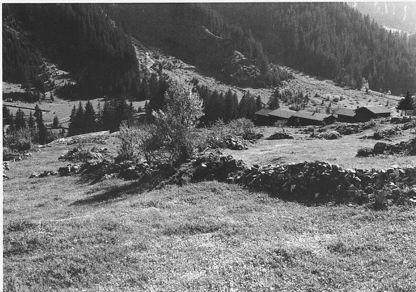
Un alpage près de Monbiel, un hameau de la commune de Klosters. Le projet communal d'aménagement des alpages empêche la dégradation de la zone alpestre environnante