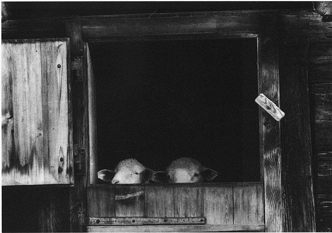
Vordemwald AG und Vrin GR.