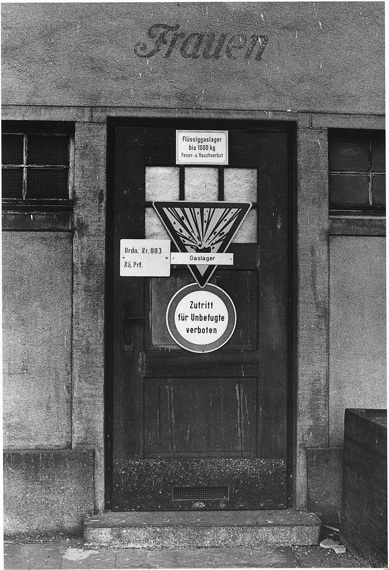
Bahnhof Zürich Wollishofen. Badischer Bahnhof, Basel.