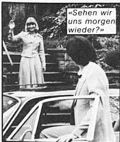
«Sehen wir uns morgen wieder?»