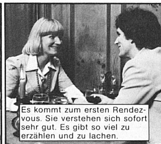
Es kommt zum ersten Rendez-vous. Sie verstehen sich sofort sehr gut. Es gibt so viel zu erzählen und zu lachen.