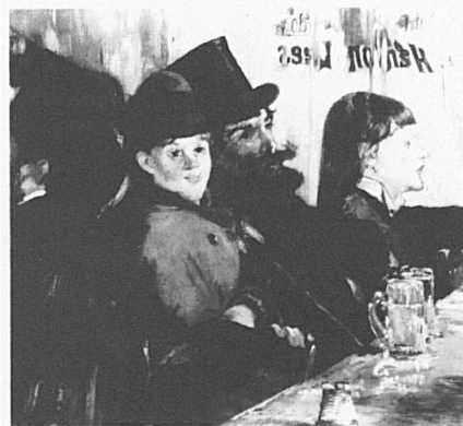
Edouard Manet. «Au café», 1878