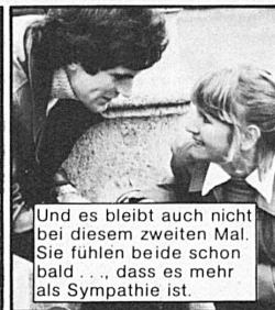
Und es bleibt auch nicht bei diesem zweiten Mal. Sie fühlen beide schon bald ... dass es mehr als Sympathie ist.