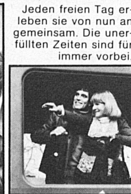
Jeden freien Tag erleben sie von nun an gemeinsam. Die unerfüllten Zeiten sind für immer vorbei.