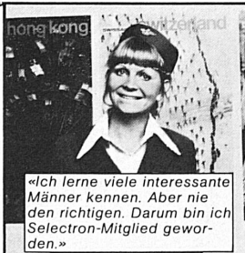
«Ich lerne viele interessante Männer kennen. Aber nie den richtigen. Darum bin ich Selectron-Mitglied geworden.»