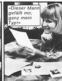
«Dieser Mann gefällt mir, ganz mein Typ!»