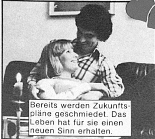
Bereits werden Zukunftspläne geschmiedet. Das Leben hat für sie einen neuen Sinn erhalten.

Und Sie? Einfach Ihren Glücksbon ausfüllen und einsenden. Er wird Ihnen zeigen, wieviele echte Partner-Chancen Sie bei Selectron haben. Lassen Sie sich kostenlos und unverbindlich überraschen mit