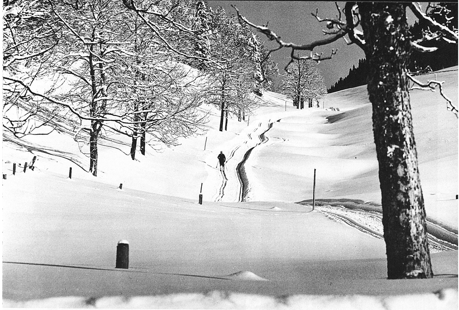
Weissenstein: Sonne, Langlaufloipen, Wanderwege... du soleil, des pistes de fond, des chemins pédestres... sole, piste di fondo, sentieri... sun, cross-country skiing trails, footpaths...