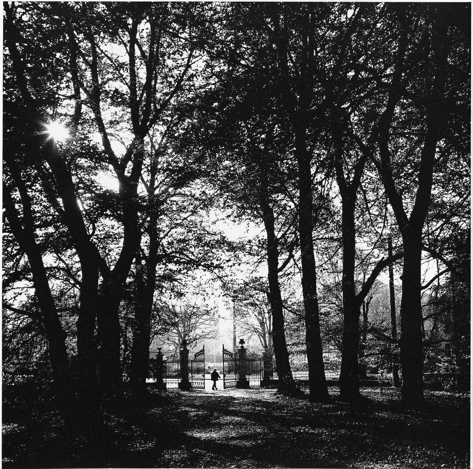
Parktor der Villa Bühler-Egg an der Lindstrasse