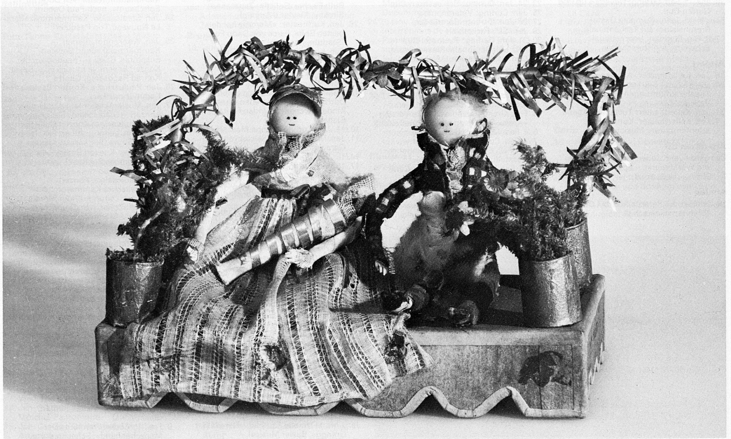
Geschenk zur Geburt eines Kindes, Patengeschenk, Klosterarbeit aus Wax und Papier, um 1800, hergestellt in einem Frauenkloster des Kantons Appenzell-Innerrhoden