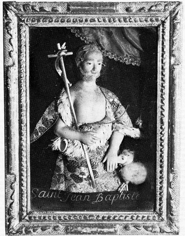
«Waxbildnis» des hl. Johannes des Täufers, künstlerische Bossierarbeit, Ende 18. Jh., Frankreich