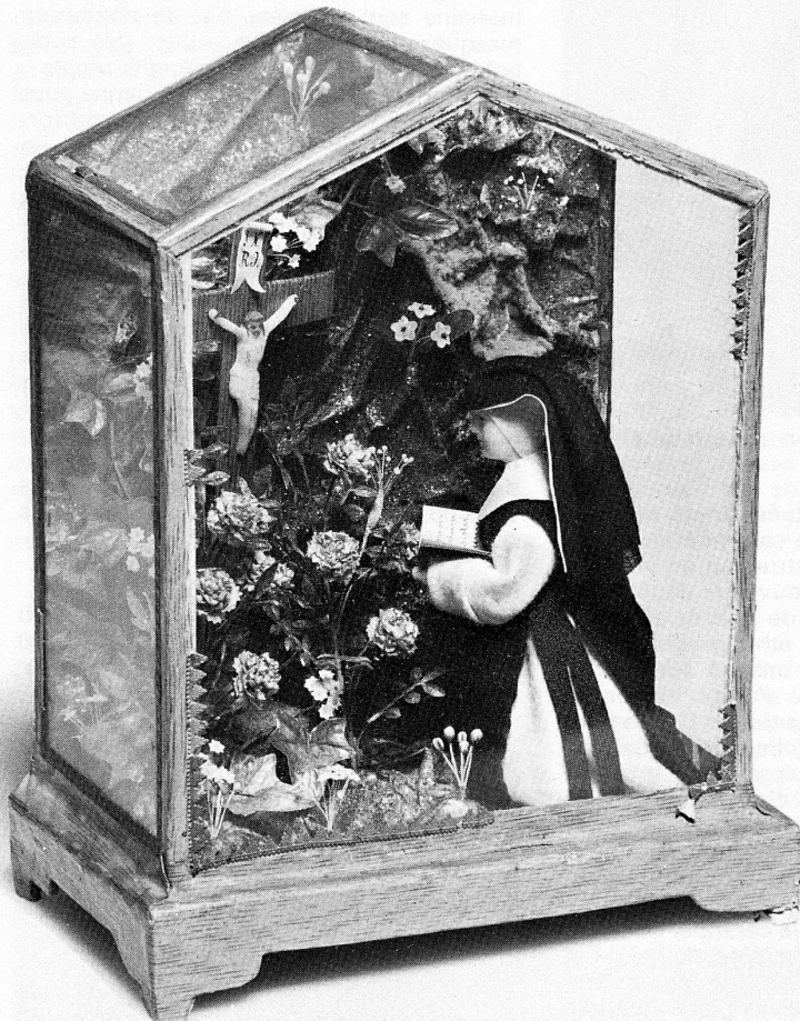
Betende Klosterfrau, Klosterarbeit, um 1840, Kloster St. Katharinen der Zisterzienserinnen von Eschenbach LU (gegründet 1285–1292)

Noch bis im Frühjahr zeigt das Schweizerische Museum für Volkskunde in Basel aus eigener Sammlung eine Sonderausstellung unter dem Thema «Wachs als Werkstoff». Wachs ist sein Jahrtausenden eine unentbehrliche Grundsubstanz im Arbeitsprogramm des Handwerks, aber ebenso ein viel verwendeter Werkstoff zum Formen und Gestalten. Der Hauptanteil macht sicher Bienenwachs aus. In volkskundlichen Sammlungen stammt die grosse Zahl der Wachsgebilde aus katholischen Gebieten. In der Schweiz lag das Hauptgewicht der Wachsverarbeitung im 18. und 19. Jahrhundert in der Innerschweiz, mit dem Mittelpunkt Einsiedeln. Dort wurden um 1850 noch jährlich 160 bis 180 Zentner Wachs zu Kerzen und Wachsgebilden verarbeitet.