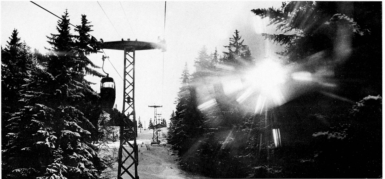
Luftseilbahn / Téléphérique / Funivia / Aerial cableway Château-d'Œx-La Bray (1630 m)