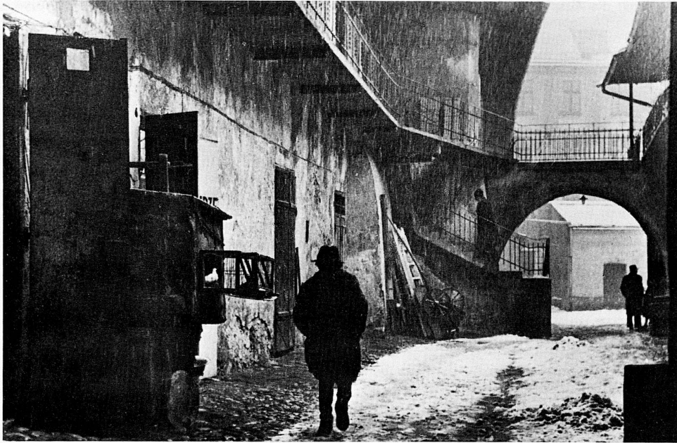
Roman Vishniac: Eingang zum Krakauer-Ghetto Kazimierz, 1937