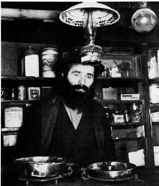
Der Händler, Ukraine, Karpaten