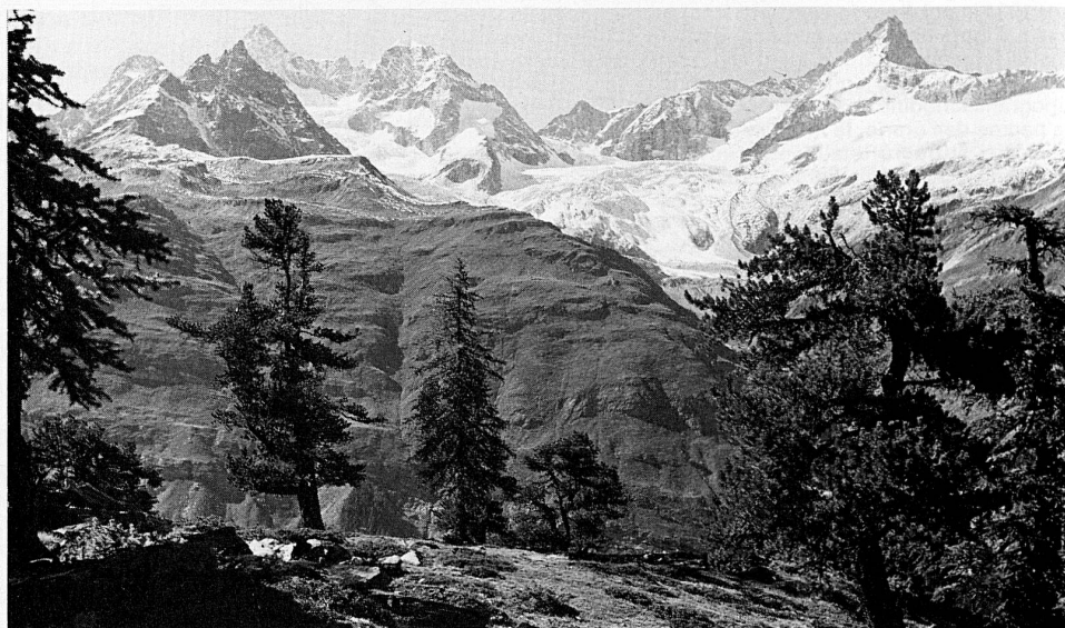
Wandergebiet Riffelalp bei Zermatt

Die Baumeler-Wandervögel aus der ganzen Schweiz treffen sich von Freitag bis Sonntag, 25. bis 27. Juni, im Binntal. Ein Strahler und ein Naturschutzaufseher machen die Teilnehmer mit der Bergflora und den Mineralien dieses Walliser Tals bekannt. Anmeldungen an Baumeler Reisen, Zinggendorstr. 1, 6000 Luzern 6, Tel. 041 50 99 00.