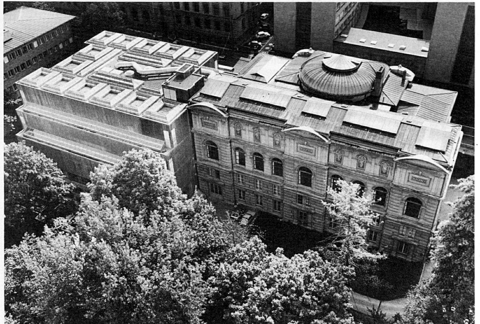
Links: Neubau 1983 / Rechts: Altes Museum von Eugen Stettler, 1879 Flugaufnahme von Balthasar Burkhard

Zur St.-Niklaus-, Weihnachts- und Neujahrszeit finden im Schweizerland verschiedene traditionelle Bräuche statt. So zum Beispiel das Klausjagen in Küsnacht am Rigi, der St.-Niklaus-Umzug zur Kathedrale von Fribourg, das historische Fest der Escalade in Genf, das Sternsingen in Rapperswil, das Silvesterklausen in Herisau, das Neujahrssingen in Bergün und am 6. Januar das Dreikönigssingen in Beromünster. Die Schweizerische Verkehrszentrale (SVZ) hat zahlreiche Veranstaltungen, die jedes Jahr um die Weihnachtszeit jung und alt erfreuen, in einem Informationsblatt zusammengefasst und auch gleich noch ein Verzeichnis aller weihnächtlichen Konzerte, Märkte, Ausstellungen und Sportanlässe hinzugefügt. Die Publikation ist kostenlos zu beziehen bei der SVZ, Postfach, 8027 Zürich.