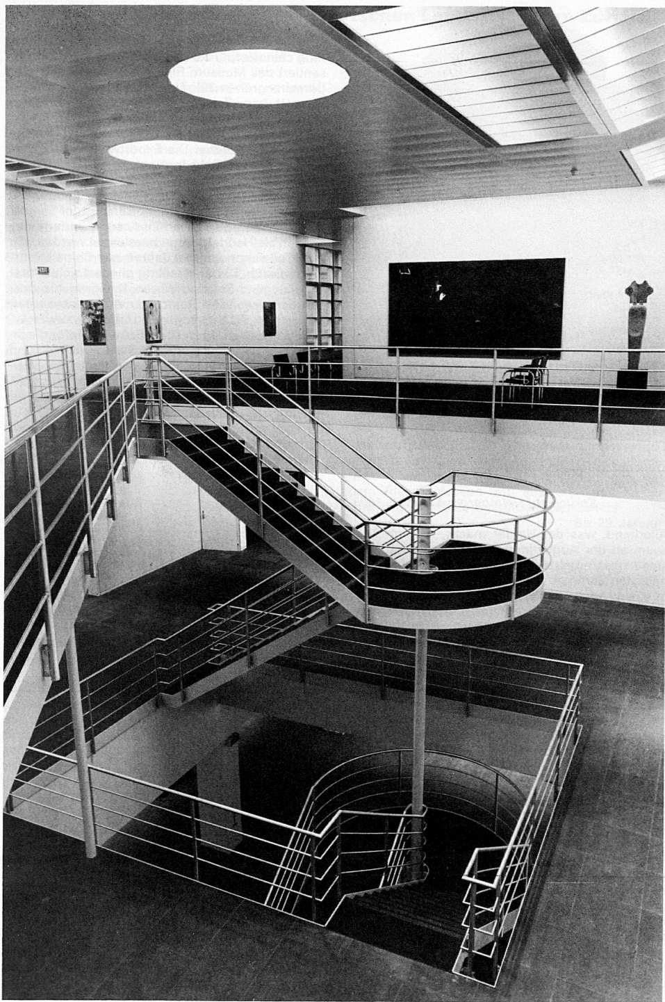
Treppenhalle im Neubau. Architekten: Atelier 5, Bern