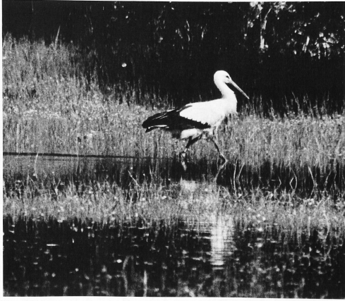
Some of the areas reclaimed by the lowering of the waters in the Jura water regulation scheme are today once more underwater during wet periods