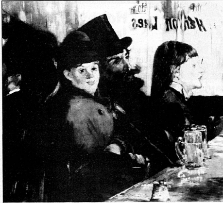
Edouard Manet, «Au café», 1878