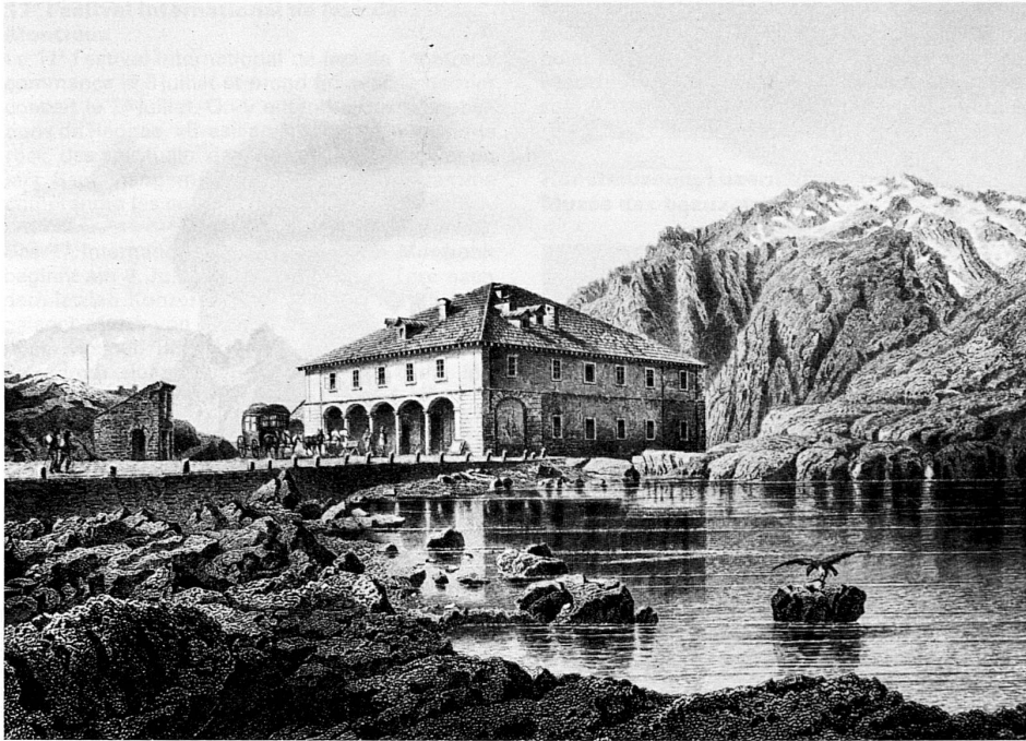
Die «Alte Sust» auf der Gotthardpasshöhe um 1850. Die später zugemauerten Arkaden sollen im Zug der Restaurierungsarbeiten wieder freigelegt werden