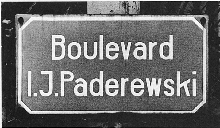
49-54 Strassennamen und Gedenktafeln erinnern an Musiker und Schriftsteller, die in der Stadt wirkten und lebten. Gedacht wird auch der ersten, in Vevey hergestellten Milkschokolade

49-54 Des noms de rues et des plaques commémoratives rappellent le souvenir de musiciens et d'écrivains qui ont vécu et œuvré à Vevey. On y commémore aussi le premier chocolat au lait fabriqué à Vevey.