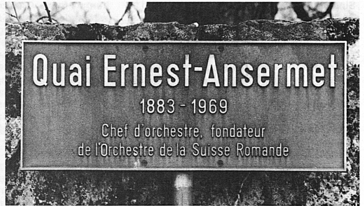
49-54 Nomi di strade e lastre commemorative ricordano musicisti e scrittori che operarono e vissero nella città. Viene pure ricordato il primo cioccolato al latte fabbricato a Vevey

49-54 Des noms de rues et des plaques commémoratives rappellent le souvenir de musiciens et d'écrivains qui ont vécu et œuvré à Vevey. On y commémore aussi le premier chocolat au lait fabriqué à Vevey.