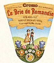
Brie de Romandie