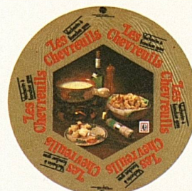
Vacherin «Les Chevreuils»