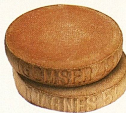
Walliser Raclette Käse, Gomser, Bagnes.