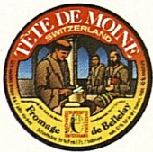
Tête de Moine