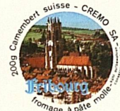
Camembert suisse Fribourg